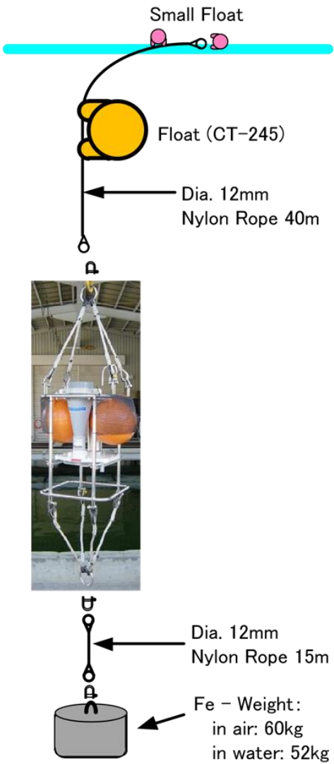
#1: Mooring Array for 50m water-depth 50m version